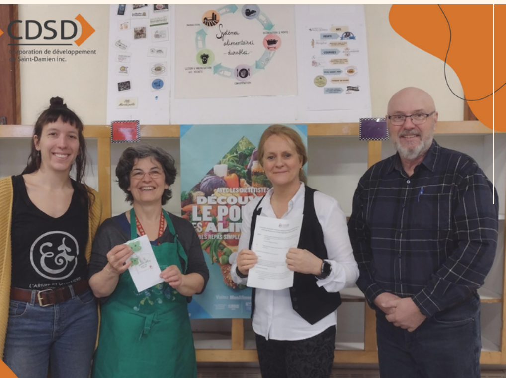
Programme d'aide financière aux entreprises

https://www.corposaintdamien.com -> services à la communauté