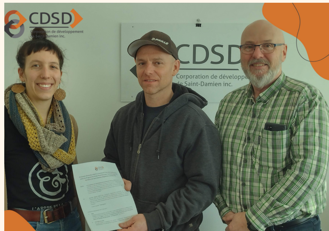
Programme d'aide financière aux entreprises

https://www.corposaintdamien.com -> services à la communauté